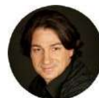
Кюрдзидис Эвклид Кириакович актер театра и кино, заслуженный артист РФ