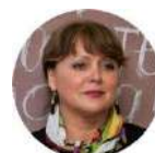
Светлова Валентина Ильинична заслуженная артистка РФ, лауреат Государственной премии России